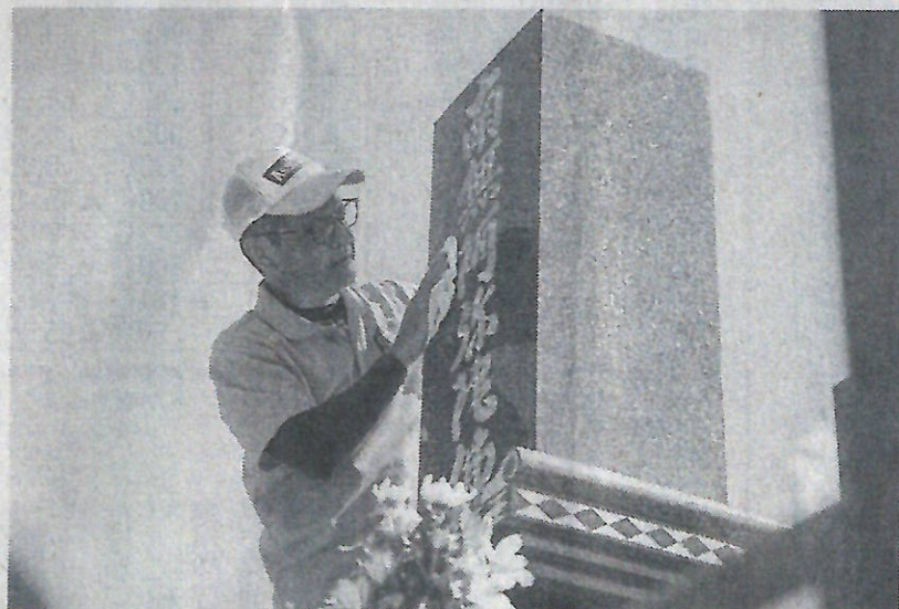
墓石クリーニングの様子

同年に墓石クリーニングを開始し、これまでの施工数は5万基を超える。自社開発のコーティング剤を使った工法は特許を取得し、全国で代理店展開している。加盟する事業者は300店を突破し、墓石以外に全国の商業施設やホテル、神社などの建造物にも施工実績がある。